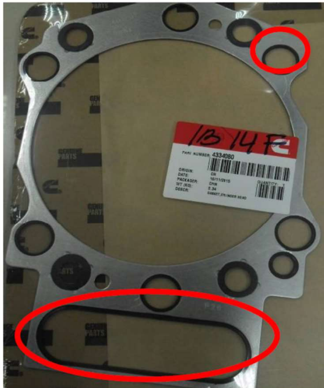
Cummins Cylinder Head Gasket