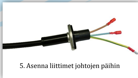
5. Asenna liittimet johtojen päihin