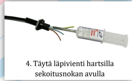
4. Täytä lämpivienti hartsilla sekoitusnokan avulla