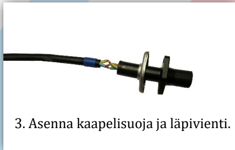
3. Asenna kaapelisuoja ja lämpivienti.