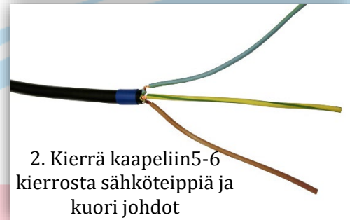
2. Kierrä kaapeliin 5-6 kierrosta sähköteippiä ja kuori johdot