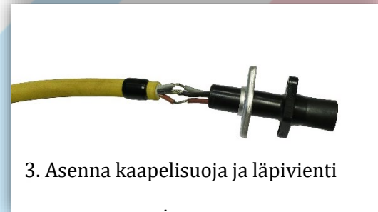
3. Asenna kaapelisuoja ja läpivienti