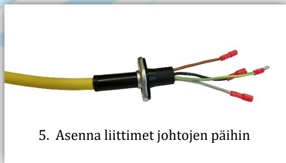
5. Asenna liittimet johtojen päihin