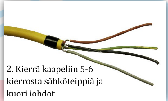
2. Kierrä kaapeliin 5-6 kierrosta sähköteippiä ja kuori iohdot