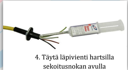
4. Täytä läpivienti hartsilla sekoitusnokan avulla