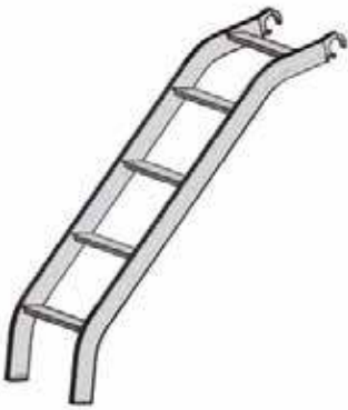
ASP (porras asennustelineelle)