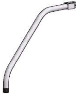
ASTJ (asennustelineen tukijalka)