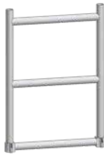
PK 67 (kaidepääty, kapea)