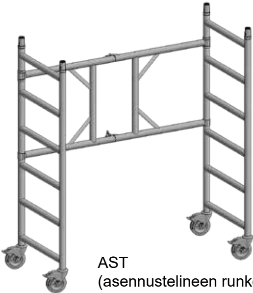
AST (asennustelineen runko)