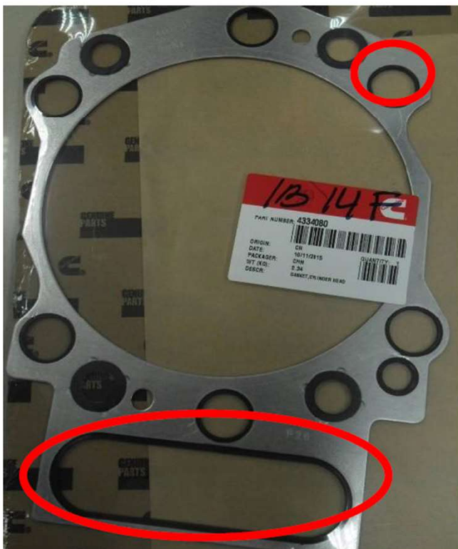
Cummins Cylinder Head Gasket